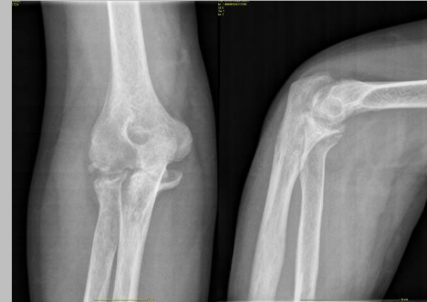
Figura 1: Radiografía preoperatoria

Varón de 33 años, como antecedentes presenta una fractura conminuta intraarticular de cabeza de radio intervenida mediante reducción abierta y fijación interna con un tornillo de compresión. La evolución del paciente es tórpida con persistencia del dolor y un rango de movilidad limitado (flexión 95º, extensión -20º, pronación 70º, supinación 15º) a los 4 años de dicha cirugía. Las exploraciones complementarias objetivan total destrucción de la interlínea articular, denudación del cartílago y erosiones subcondrales. Ante dichos hallazgos se decide realizar una artroplastia de interposición con tendón de Aquiles y colocación de fijador externo que se retira a los dos meses postoperatorios. Durante el seguimiento se evalúa periódicamente al paciente según el rango de movilidad, la calidad de vida subjetiva según la Mayo Elbow Performance Score (MEPS) y la realización de radiografías seriadas.