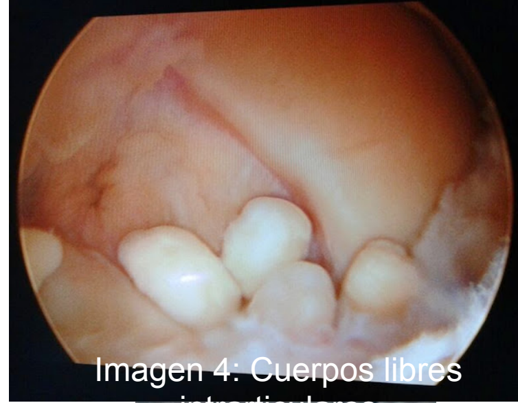
Imagen 4: Cuerpos libres intrarticulares