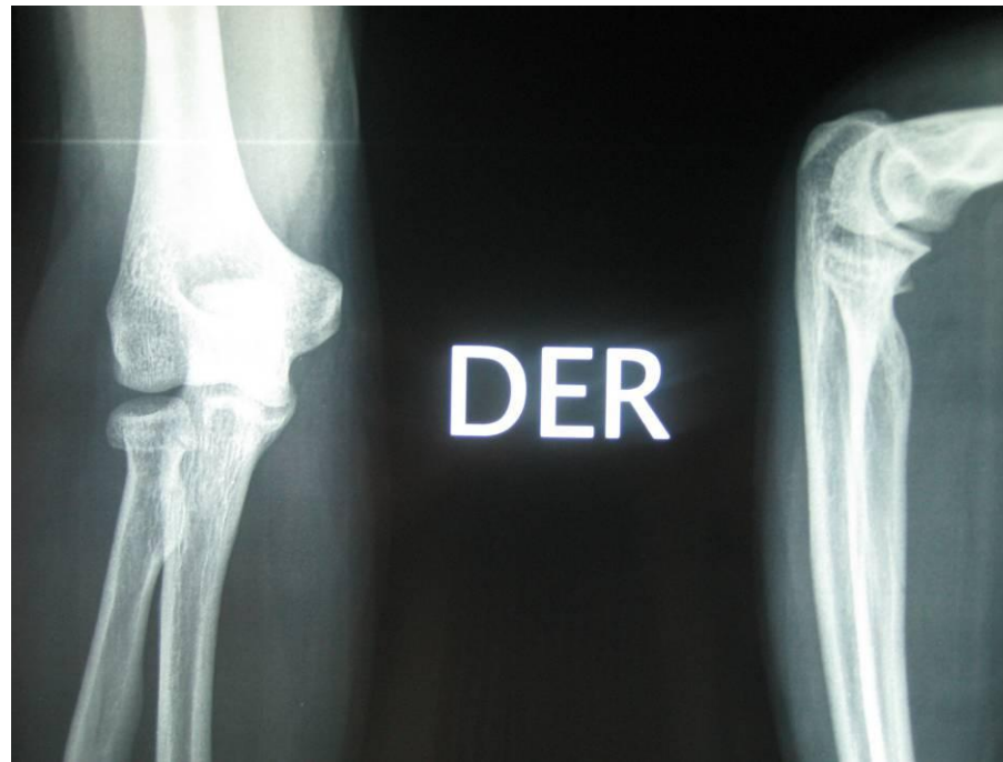
RADIOGRAFIA DE URGENCIA